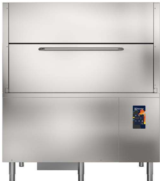
Lavavajillas eléctrico con control electrónico, bomba de desagüe, dispensador de detergente